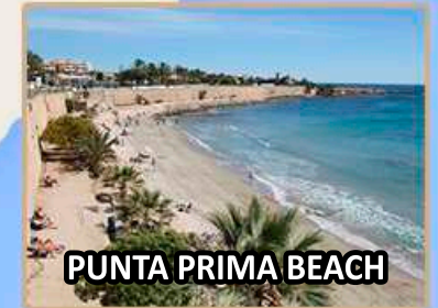
PUNTA PRIMA BEACH