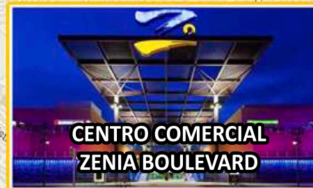
CENTRO COMERCIAL ZENIA BOULEVARD